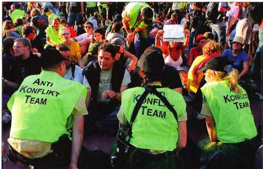
Reden statt Wasserwerfer-Einsatz: Mitglieder des „Anti-Konflikt-Teams“ der Polizei sprechen in Rostock mit Gegnern des G8-Gipfels. Derartige Teams sind auch bei Castor-Transporten im Einsatz.